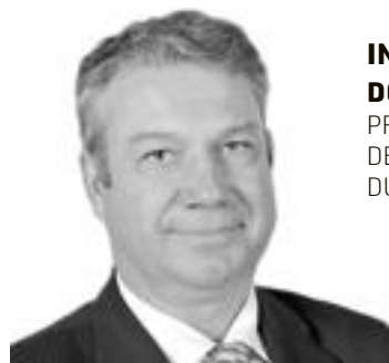
INTERVIEW DOMINIQUE LEFEBVRE PRÉSIDENT DE LA FÉDÉRATION NATIONALE DU CRÉDIT AGRICOLE

« La chute du cours n'impacte pas les caisses régionales »