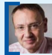
PAR PIERRE-ANGEL GAY

La chute vertigineuse de Royal Bank of Scotland à la Bourse de Londres lundi, et celle des valeurs bancaires en Europe qui s'en est suivie, est venue rappeler aux investisseurs qu'une nouvelle bombe pouvait exploser à tout moment sur des marchés déjà chahutés. La grande banque britannique avait annoncé 15 à 20 milliards de dépréciation d'actifs pour solder l'achat en 2007 du tiers de sa concurrente ABN-Amro. Les boursiers ont alors pris conscience du coût potentiel de ces dépréciations, liées à des acquisitions faites au plus fort de l'envolée des cours. Un danger qui ne menace pas que les banques puisque, selon le cabinet spécialisé Alpha Value, le montant total des dépréciations que pourraient être contraintes de passer 330 sociétés européennes, pourrait atteindre les 360 milliards d'euros ! De quoi lessiver les comptes. En France, par exemple, certains des plus beaux fleurons du CAC, Lafarge, PPR, Saint-Gobain ou Veolia, pourraient être touchés. Cette bombe à retardement est le dernier avatar des nouvelles normes comptables. Avant, les « survaleurs » payées par les entreprises pour certaines de leurs acquisitions pouvaient être amorties dans la durée. Aujourd'hui, ce n'est plus possible puisque la dictature comptable réclame une photographie de la valeur des entreprises instantanée, collant aux réalités les plus immédiates,