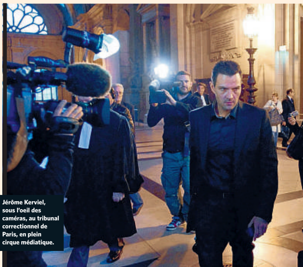
Jérôme Kerviel, sous l'oeil des caméras, au tribunal correctionnel de Paris, en plein cirque médiatique.