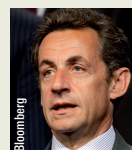
Nicolas Sarkozy, président de la République française

« Etendre la régulation ; renforcer le mandat du Forum de la stabilité financière (...); revoir le cadre prudentiel des établissements bancaires (...): sur tous ces sujets, des propositions précises seront sur la table, d'abord pour préparer au mieux le Sommet de Séoul, puis pour en prolonger les résultats en 2011 »