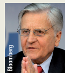
Jean-Claude Trichet, président de la Banque centrale européenne

« Les 'stress tests' confirment la résistance du système bancaire à des chocs économiques et financiers sévères. C'est également un exercice de transparence (...) C'est un pas important en direction de la restauration de la confiance des marchés »