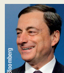
Mario Draghi, président du Comité de stabilité financière (FSB)

« L'analyse montre que les coûts macroéconomiques de la mise en place de normes plus solides sont raisonnables (...) alors que les bénéfices à plus long terme pour la stabilité financière et de la croissance économique sont importants »